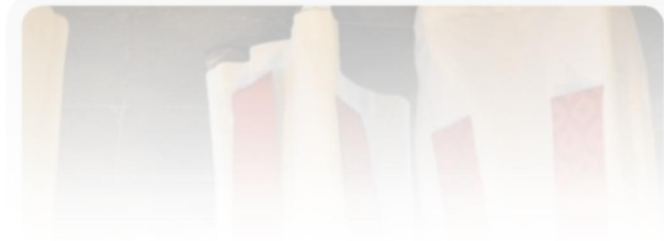
Lors des confirmations du 29 mai 2010